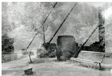
Aus der Serie Three Times a Day No1, 2010, © Beate Spitzmüller