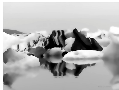
Aus der Serie Corpora No3, 2015 © Beate Spitzmüller