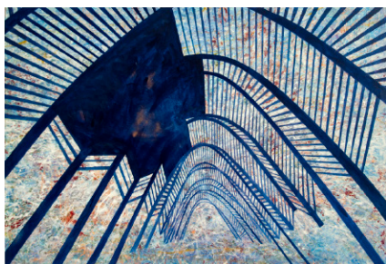
moves11 crawl, Athen OAKA Calatrava, 2019