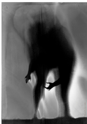
Aus der Serie A Contre Jour – ShapeChanging No1, 1993 © Beate Spitzmüller