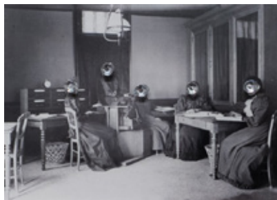
Links: Aus der Serie „Constellations“, Constellation of Female Labour (Dorothea Klumpke et les dames de la Carte du Ciel, Observatoire de Paris), 2026 © Sabrina Labis Rechts: Aus der Serie „Constellations“, Constellation of Female Labour (Dorothea Klumpke, Mesdemoiselle Schott, Marquette, Coniel und Dauphin), 2026 © Sabrina Labis