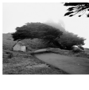
Point Reyes , Kalifornien, USA, 2006