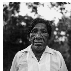
Mayanischer Schamane , Yucatán, Mexiko, 1987