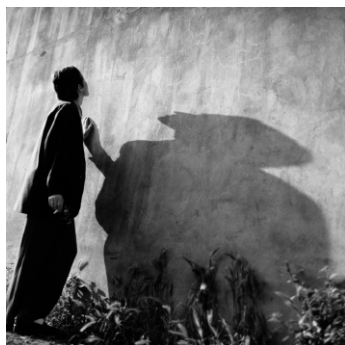
Tänzerin, Cihangir, Istanbul, 1992

Die Fotografin und Psychologin Christa Mayer hat in den vergangenen vier Jahrzehnten ein unverwechselbares fotografisches Werk geschaffen. Mit der Ausstellung „Christa Mayer. Fotografie – Das Werk“ präsentiert das Haus am Kleistpark einen umfassenden Einblick in ihr Œuvre. Gezeigt werden Fotografien in Schwarzweiß und Farbe aus unterschiedlichen Werkreihen, darunter bedeutende Werkkomplexe wie „Abwesende I / II“ (1979–1996), „Heilende“ (1982–1989) sowie „Kreative“ (1987) und „Kinder“ (1987–1992). Ergänzt werden die Serien durch Beobachtungen aus Italien sowie Istanbul (1979–1992). Darüber hinaus sind Landschaftsaufnahmen (1982–2011)