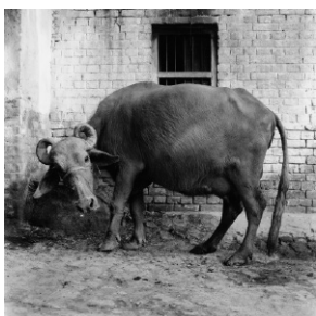
Büffelkuh , Varanasi, Indien, 2001