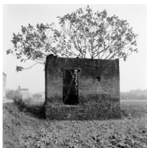
Ohne Titel, Jaipur, Indien, 2001