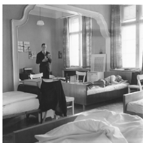
Ohne Titel, aus der Serie Abwesende I , 1979–1986

Am 3. Dezember 2025 ist im DISTANZ Verlag die gleichnamige Monografie erschienen, herausgegeben von Carolin Förster und mit Texten von Carolin Förster, Thomas Weski, Maren Lübbke-Tidow und Barbara Esch Marowski.