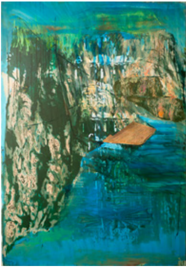
© Ina Bierstedt „Dach und Fels“, 2020