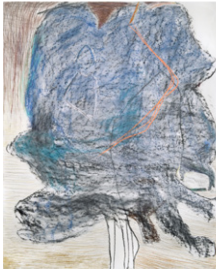
„Faun-Baum“, 2019-2020