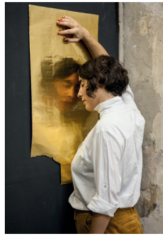
© C. Balsters, H. Goldstein, „Dear Claude (Cahun) I“, 2019–2021