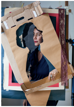
© C. Balsters, H. Goldstein, „Dear Hannah (Höch) I“, 2019–2021