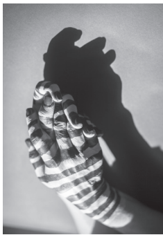
© C. Balsters, H. Goldstein, „Dear Claude (Cahun) II“, 2019–2021