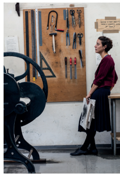
© C. Balsters, H. Goldstein, „Dear Käthe (Kollwitz)“, 2019–2021